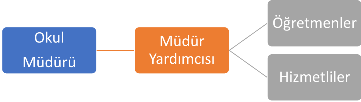
Şekil 3. Teşkilat Yapısı