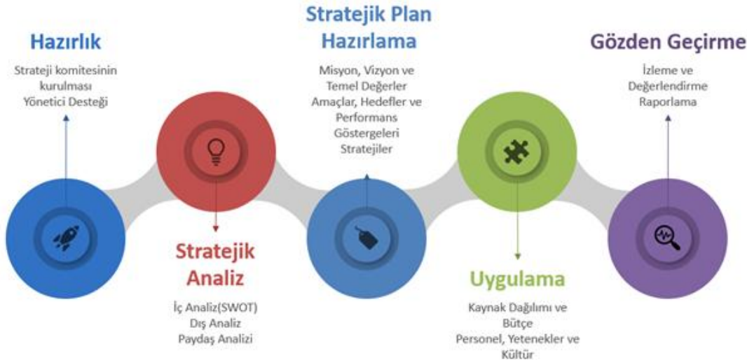
Şekil 1. Hazırlık süreci

2024-2028 dönemi stratejik plan hazırlanma süreci Strateji Geliştirme Kurulu ve Stratejik Plan Ekibi'nin oluşturulması ile başlamıştır. Ekip tarafından oluşturulan çalışma takvimi kapsamında ilk aşamada durum analizi çalışmaları yapılmış ve durum analizi aşamasında, paydaşlarımızın plan sürecine aktif katılımını sağlamak üzere paydaş anketi, toplantı ve görüşmeler yapılmıştır. Durum analizinin ardından geleceğe yönelim bölümüne geçilerek okulumuzun amaç, hedef, gösterge ve stratejileri belirlenmiştir.